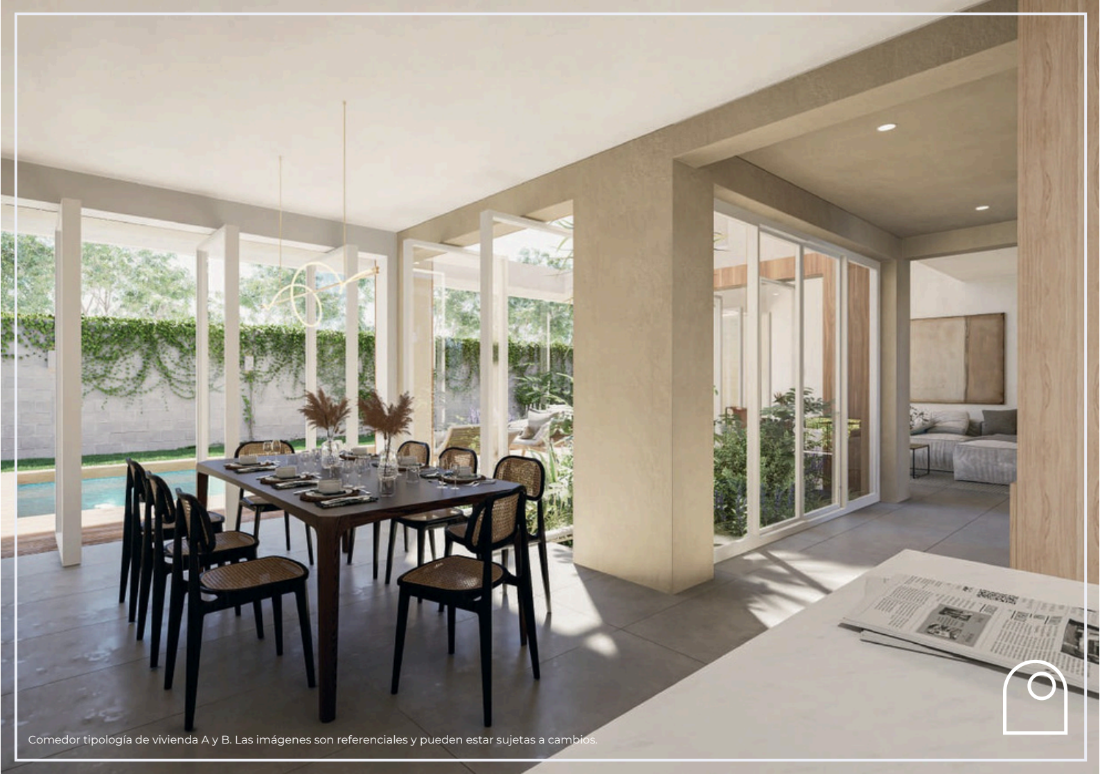
Comedor tipología de vivienda A y B. Las imágenes son referenciales y pueden estar sujetas a cambios.