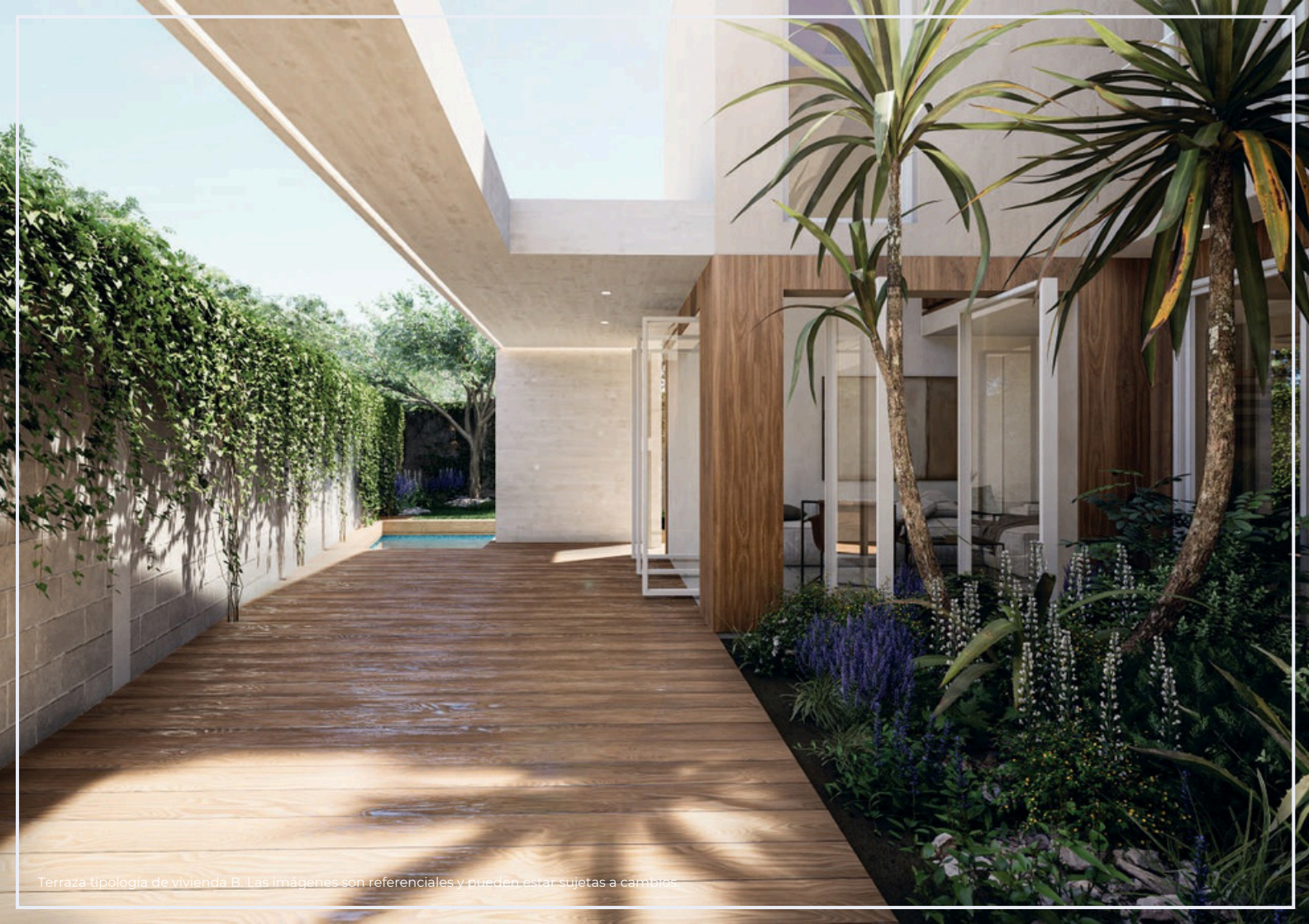
Terraza tipología de vivienda B. Las imágenes son referenciales y pueden estar sujetas a cambios.