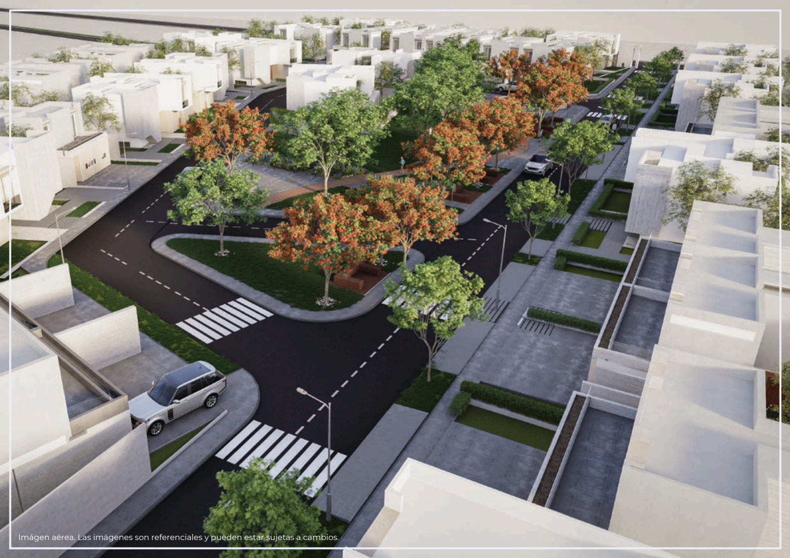
Imagen aérea. Las imágenes son referenciales y pueden estar sujetas a cambios.