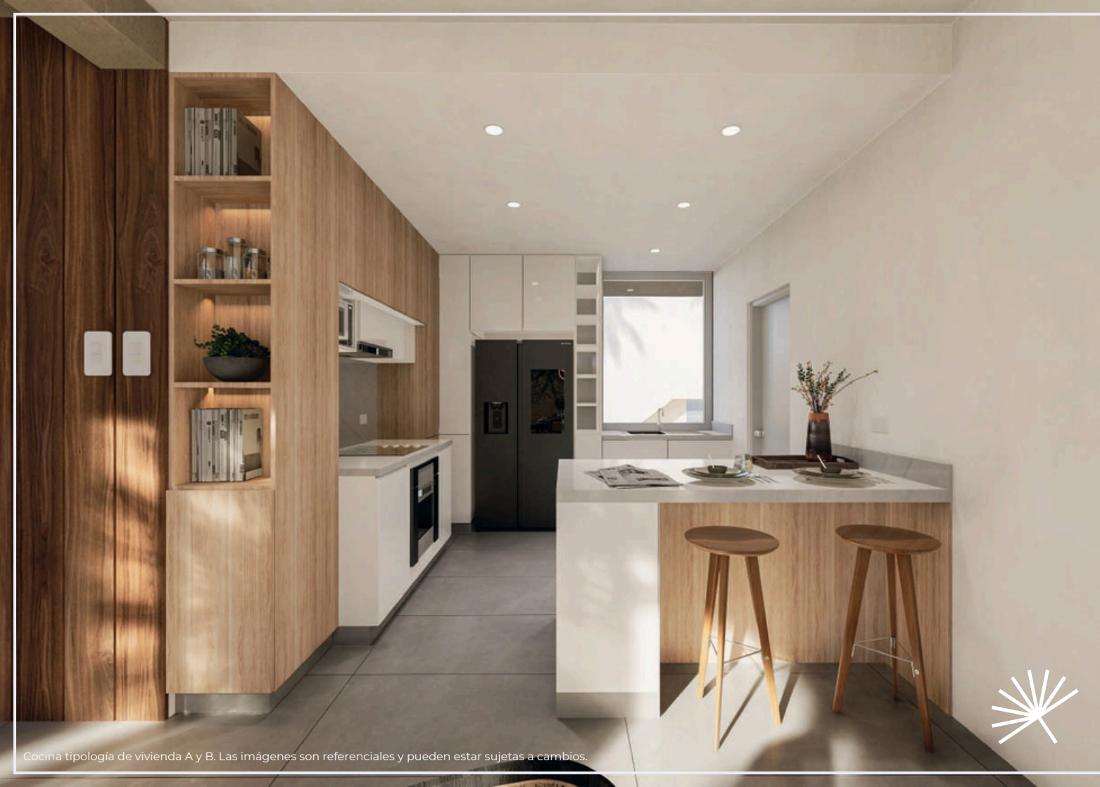
Cocina tipología de vivienda A y B. Las imágenes son referenciales y pueden estar sujetas a cambios.