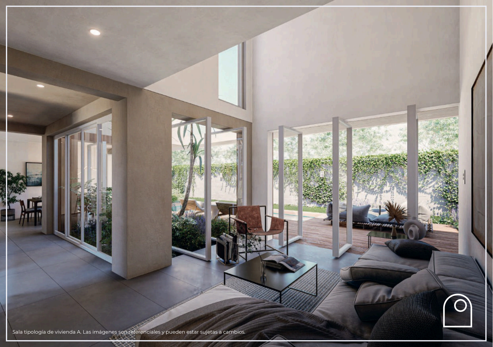
Sala tipología de vivienda A. Las imágenes son referenciales y pueden estar sujetas a cambios.