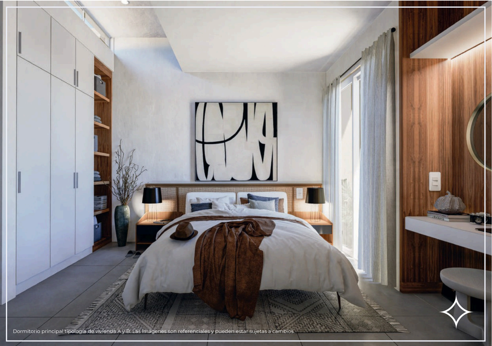
Dormitorio principal tipología de vivienda A y B. Las imágenes son referenciales y pueden estar sujetas a cambios.