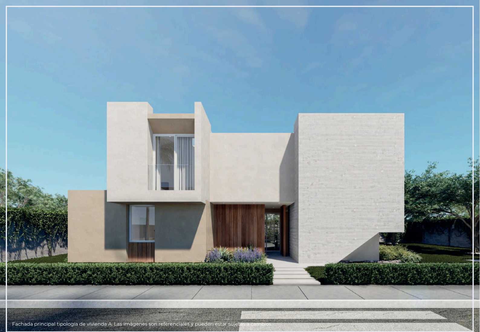
Fachada principal tipología de vivienda A. Las imágenes son referenciales y pueden estar sujetas a cambios.